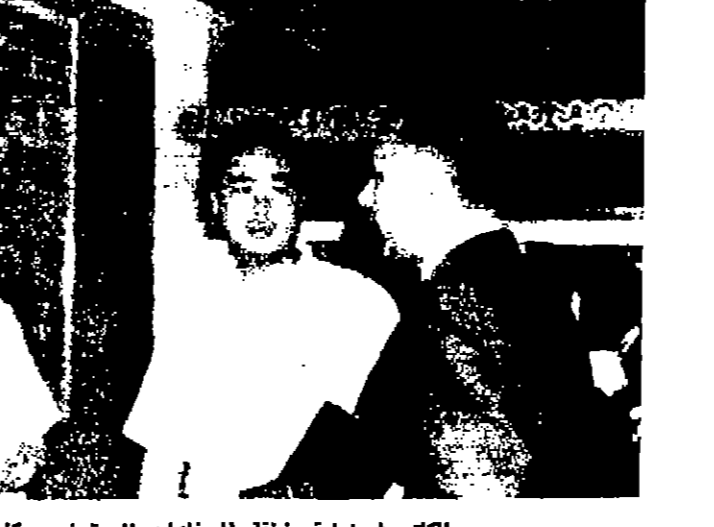
الكتب في زيارة منطقة الصناعات الحرة في كوشونج

توسيع المباد ان بني صادرات الجزيرة وورداتها يير من ميناء « كوشونج » وفي الميناء الآن تسعة وعشرون رسفا يمكنها ترخيص تسع وخمسين سفينة في نفس الوقت . وما يكثر ان الميناء كله يقوم على ارض اكتسبت من البحر ، وقد بدأوا منذ عام ١٩٥٨ في تنفيذ مشروع توسعة الميناء بزيادة عدد الارصفة بحيث يصبح بعد انجازه من اكثر الموانئ في الشرق الاقصى على الاطلاق . وستنجز اعمال التوسعة ردم ما مساحته اربع وسبعين هكتارا من الارض التي تغطيها الان مياه البحر الفصحى بحوالي عشرين مليوناً من اطنان الرمل ، والانتقال من سياسة الحكومة الرامية الى تشجيع استثمار رؤوس